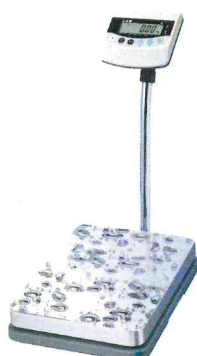
BW (Max=60, 150 кг)