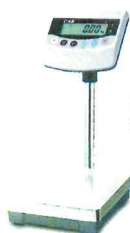
BW (Max=6, 15, 30 кг)